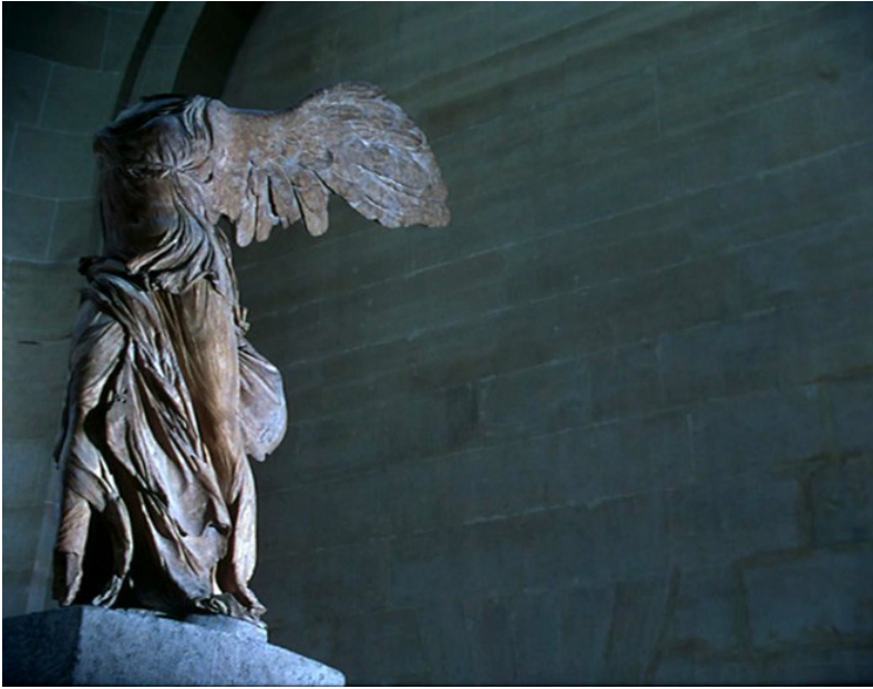
Une visite au Louvre (2004)