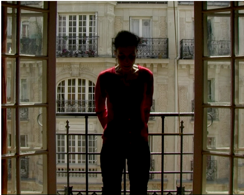
Corneille-Brecht ou Rome l'unique objet de mon ressentiment (2009)