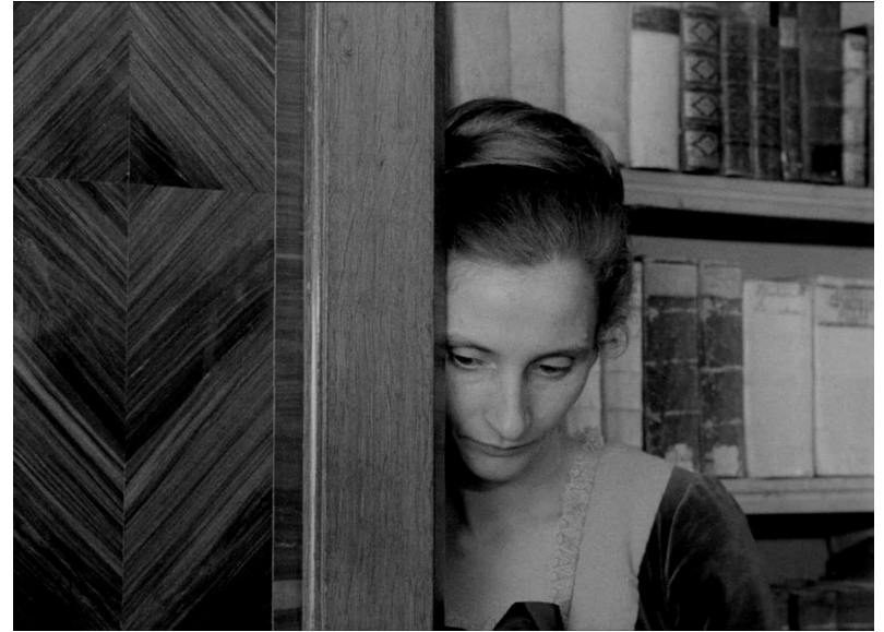
Chronik der Anna Magdalena Bach (1968)