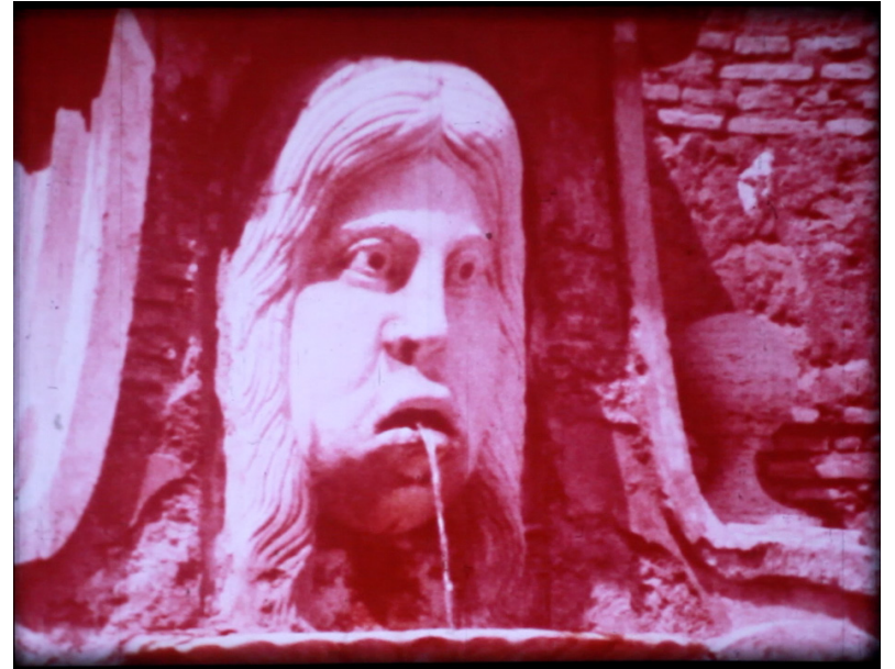
In omaggio all'arte italiana! (2015)