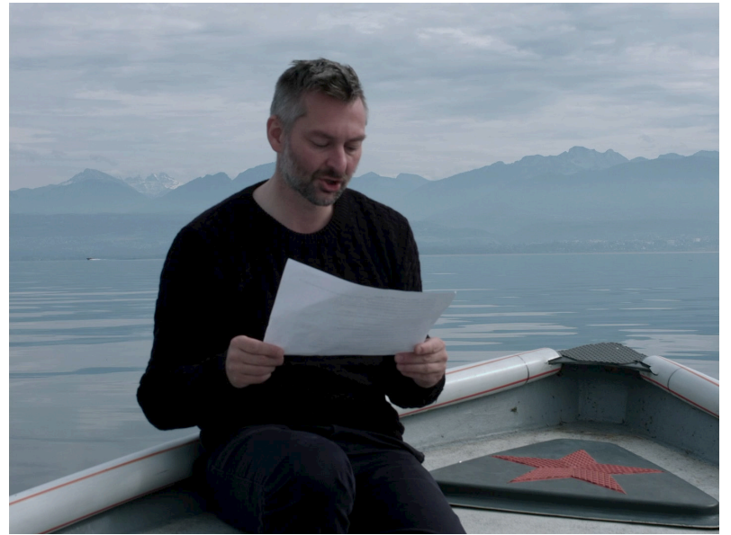
Gens du lac (2018)