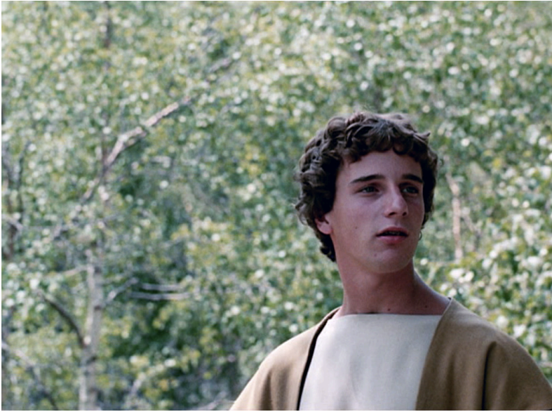
Der Tod des Empedokles oder – Wenn dann der Erde Grün von neuem Euch erglänzt (1987)