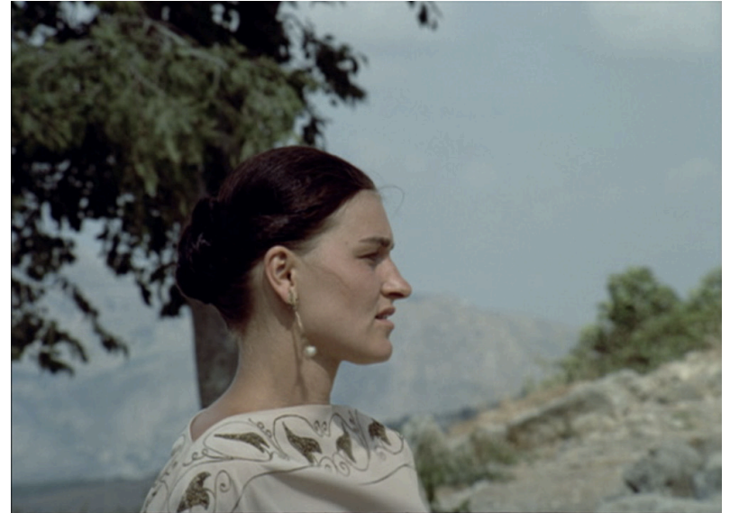
Die Antigone des Sophokles nach der Hölderlinschen Übertragung für die Bühne bearbeitet von Brecht 1948 (1992)