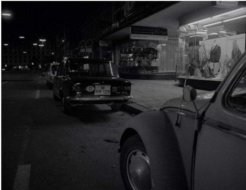
Der Bräutigam, die Komödiantin und der Zuhälter (1968)