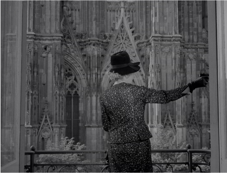
Nicht versöhnt oder Es hilft nur Gewalt, wo Gewalt herrscht (1965)