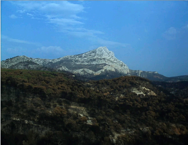
Cézanne – Dialogue avec Joachim Gasquet (1990)