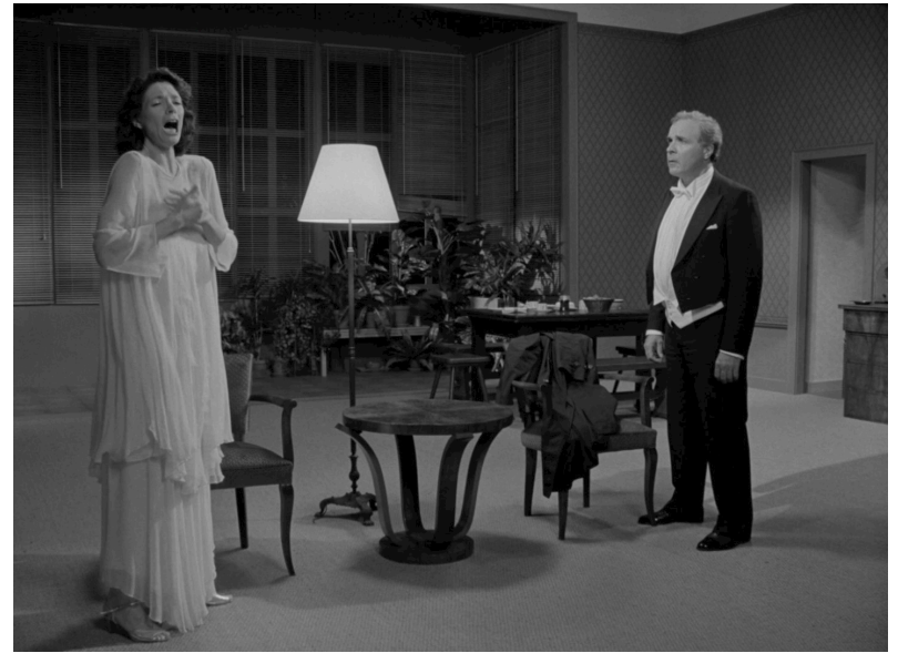
Von heute auf morgen (1997)