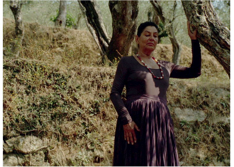
Quei loro incontri (2006)