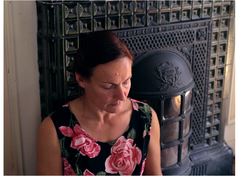
Un conte de Michel de Montaigne (2013)