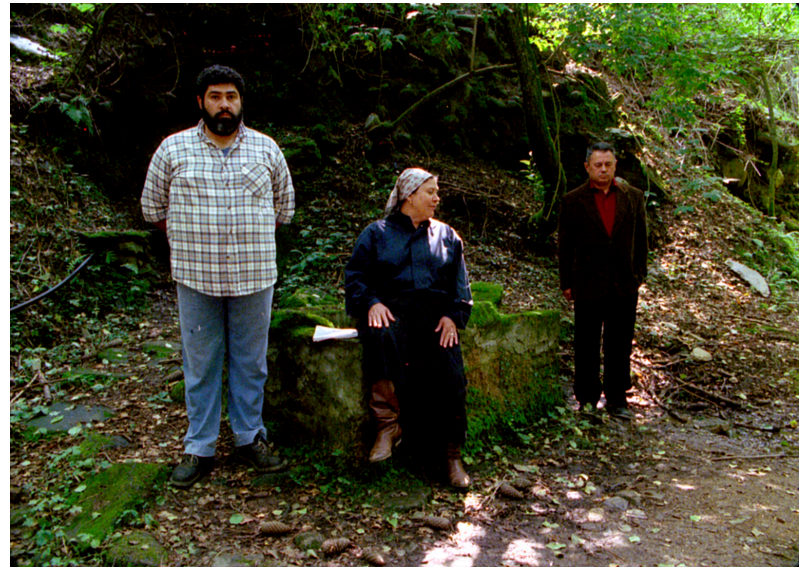
Operai, contadini (2001)