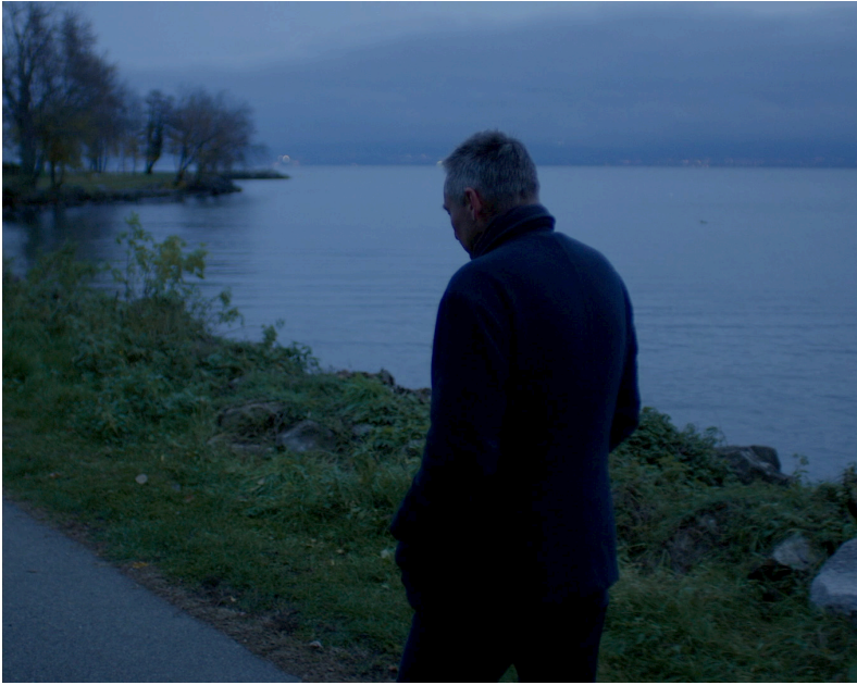
La France contre les robots (2020)