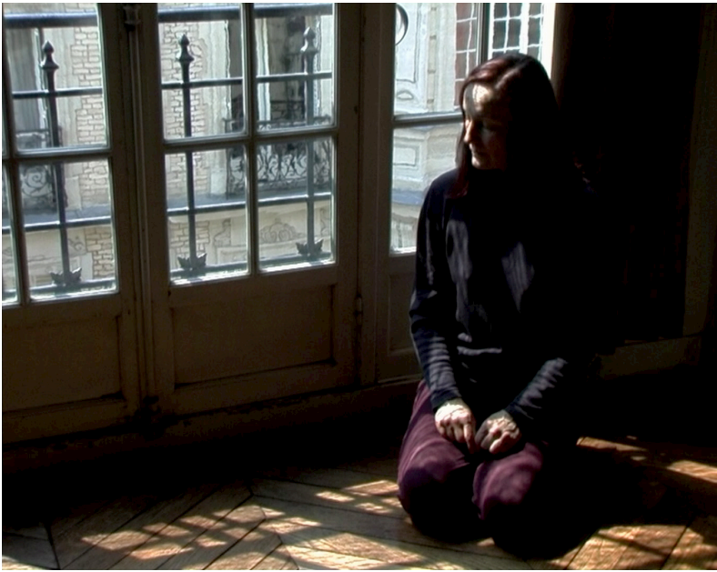
Schakale und Araber (2011)