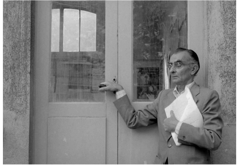
En rachâchant (1982)