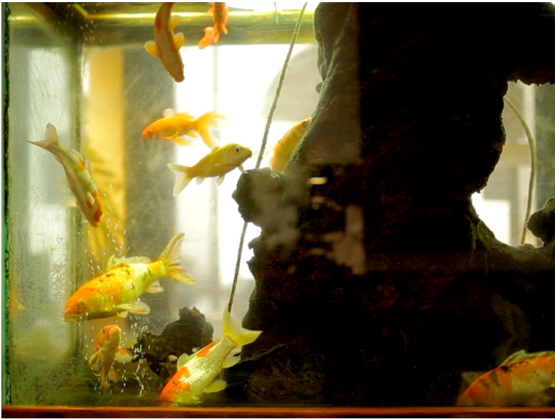
L'Aquarium et la Nation (2015)