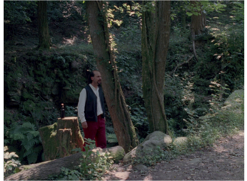
Il ritorno del figlio prodigo (2003)