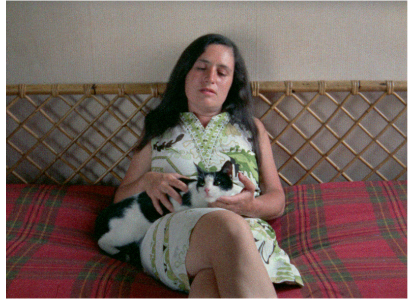
Einleitung zu Arnold Schoenbergs Begleitmusik zu einer Lichtspielszene (1973)