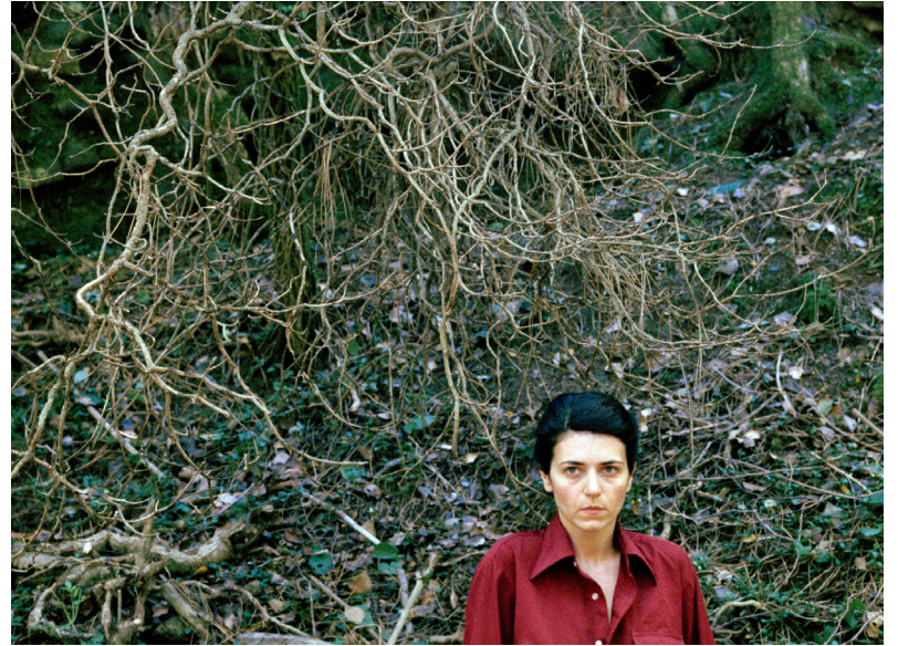
Le streghe, femmes entre elles (2009)