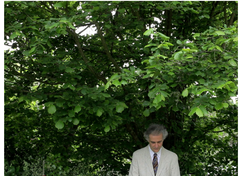
Dialogue d'ombres (2014)