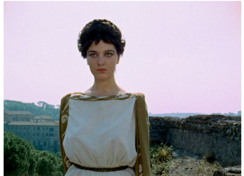
Les yeux ne veulent pas en tout temps se fermer, ou Peut-être qu'un jour Rome se permettra de choisir à son tour (1970)