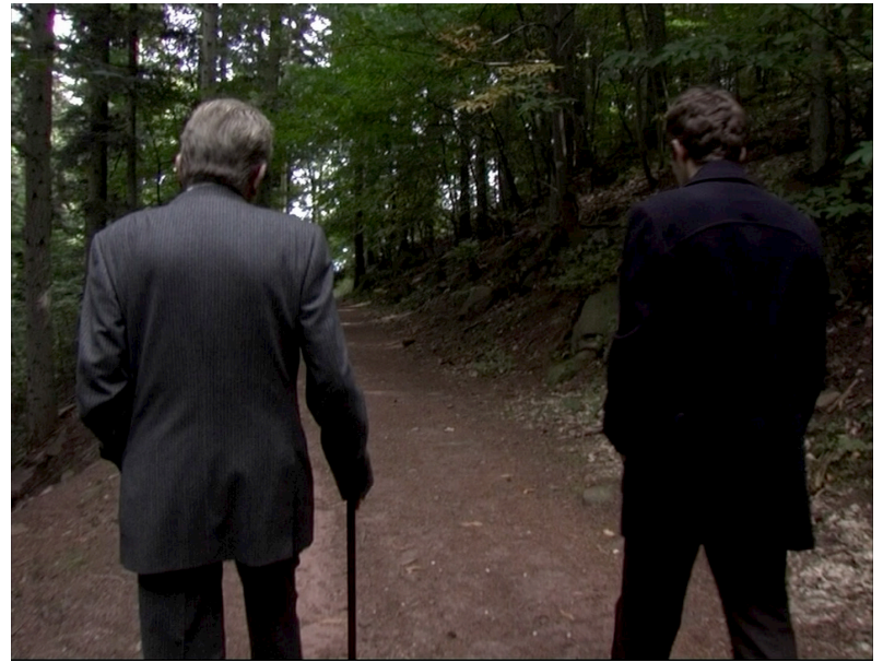
Un héritier (2012)