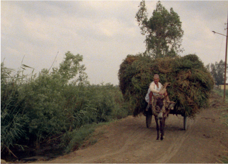
Trop tôt/Trop tard (1981)