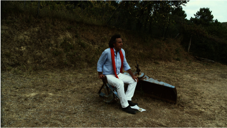
O somma luce (2010)