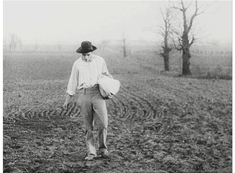
Proposta in quattro parti (1985)