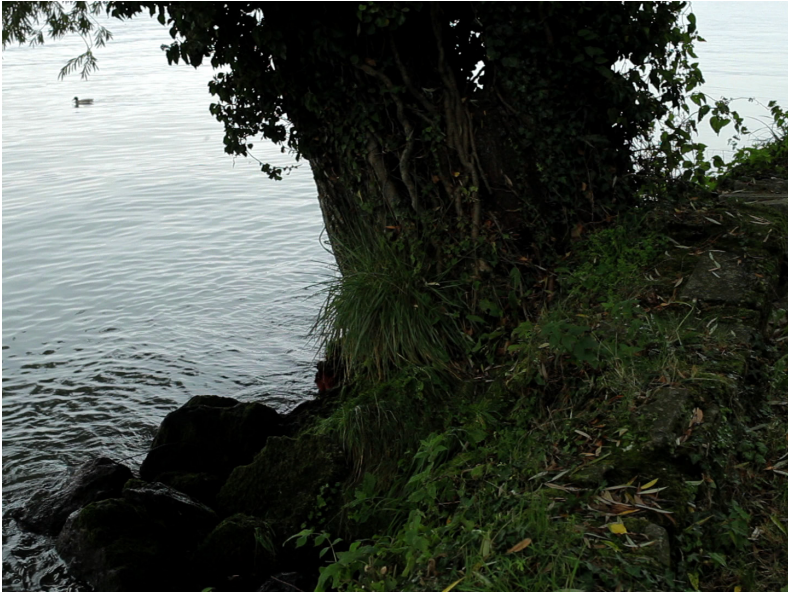
À propos de Venise (Geschichtsunterricht) (2014)