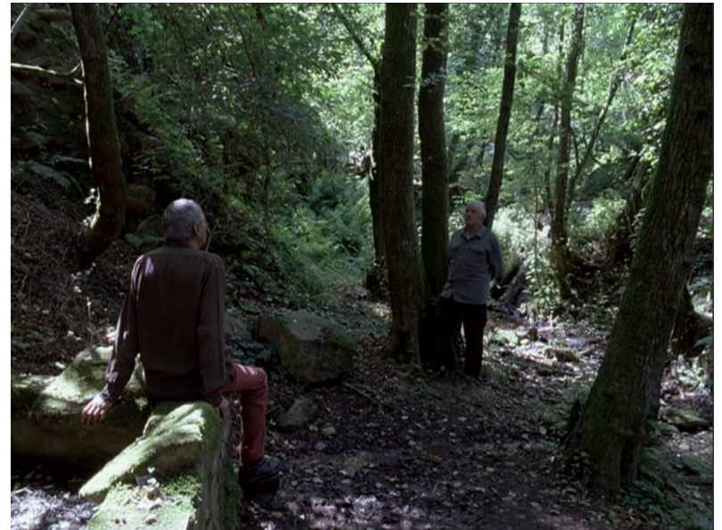
Le genou d'Artémide (2008)