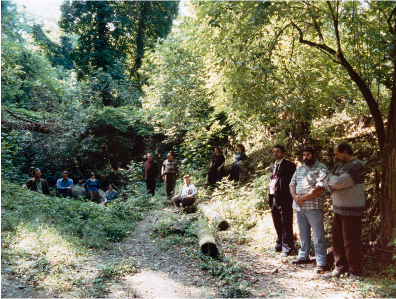
Umiliati che niente di fatto o toccato da loro, di uscito dalle mani loro, risultasse esente dal diritto di qualche estraneo (Operai, Contadini - seguito e fine) (2003)