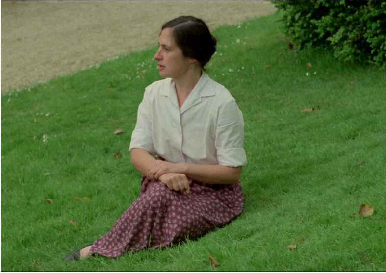
Toute révolution est un coup de dés (1977)