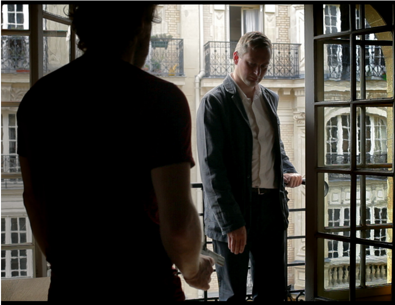
La guerre d'Algérie! (2014)