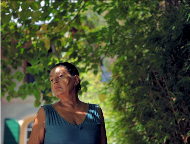
La madre (2012)