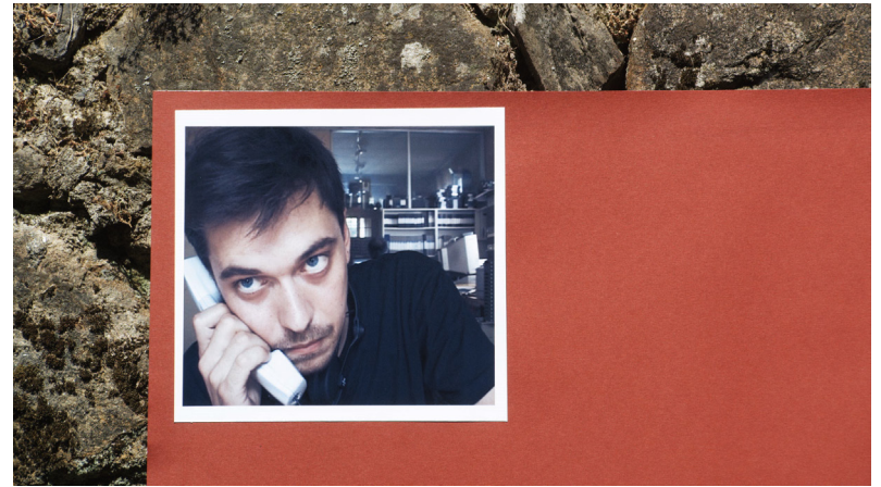
Joachim Gatti, variation de lumière (2009)