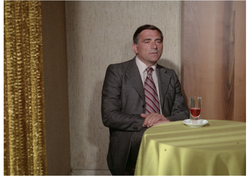
Dalla nube alla resistenza (1979)