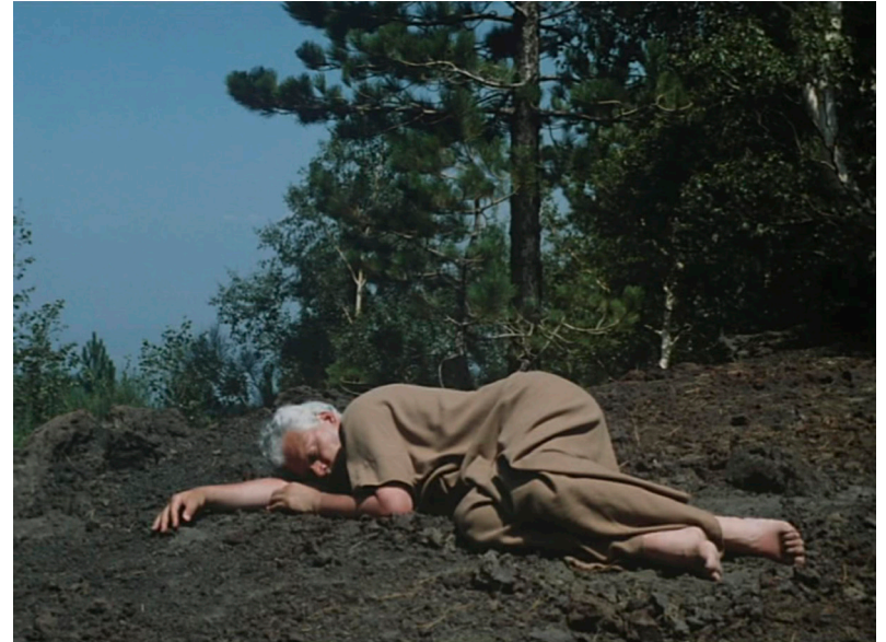
Schwarze Sünde (1989)