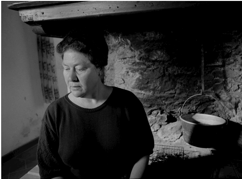
Il viandante (2001)