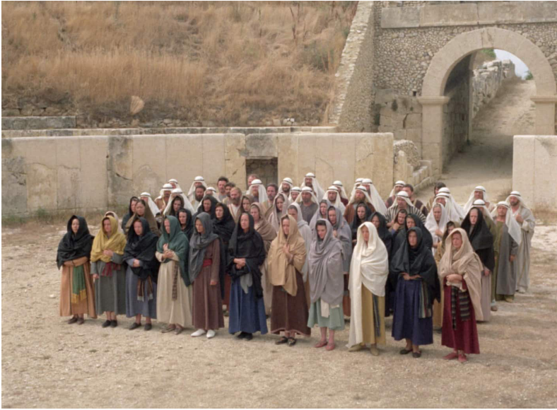
Moses und Aron (1975)